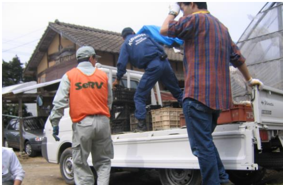
福岡西方沖地震での災害ボランティア活動の様子

近年、我が国では東日本大震災をはじめ、大規模災害が多発しており、豪雨、台風、竜巻による局地的な災害は毎年起きています。